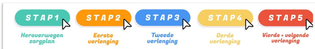
Figuur: Wzd stappenplan

De nieuwe wet stelt echter andere eisen aan de inzet van vrijheidsbeperkende middelen en maatregelen en vraagt een juiste zorgvuldige afweging van inzet van deze middelen. Hiervoor zal de zorgverantwoordelijke samen met andere disciplines, volgens een vast stappenplan moeten werken. Dit vraagt nieuwe kennis en vaardigheden.